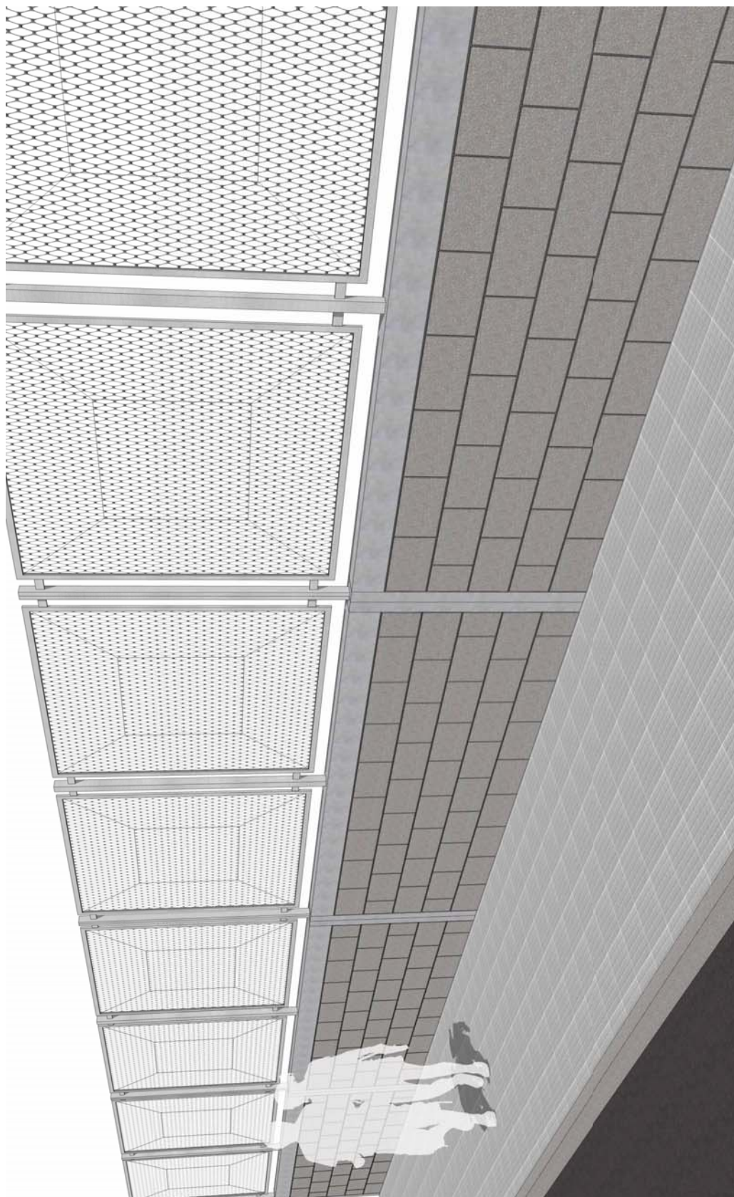
▲ Infografía del cerramiento de las parcelas.